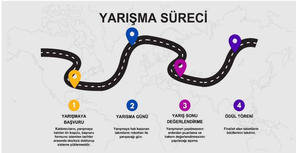
Şekil 1: Yarışma süreci yol haritası